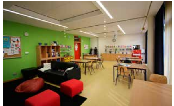
Gruppenraum der Offenen Ganztagschule in der Mittelschule Veitshöchheim

Die Kinder und Jugendlichen werden in speziell dafür eingerichteten Gruppenräumen im Schulgebäude der Mittelschule Veitshöchheim betreut. An die beiden Gruppenräume ist eine Zubereitungsküche angeschlossen. Auch die schuleigene Turnhalle, der Sportplatz und das Freigelände können genutzt werden.